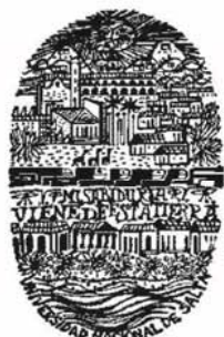
Universidad Nacional de Salta